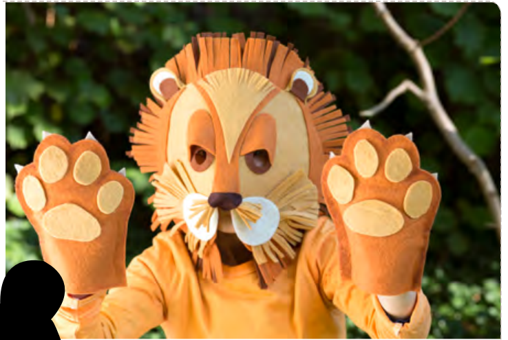
Le lion pg 12