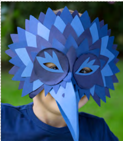
Le corbeau pg 11