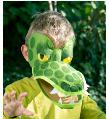
Le crocodile pg 12