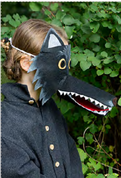
Le loup pg 12